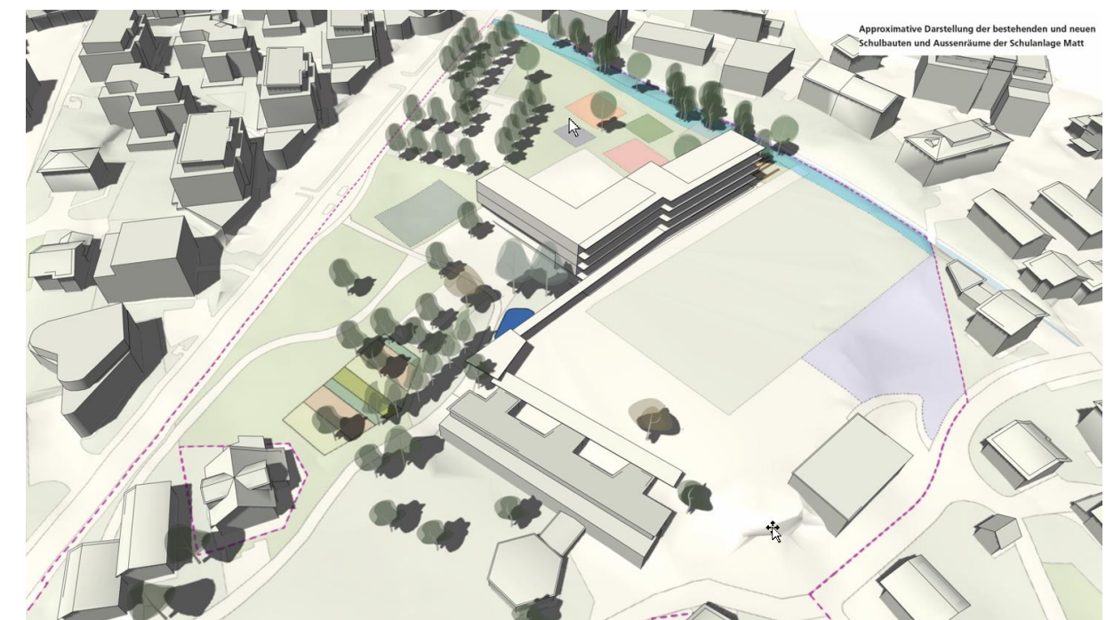
Abbildung: Visualisierung Machbarkeit