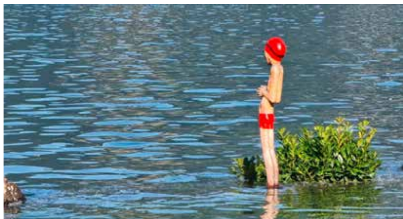
Seehochwasser 2021. "Der Fischer" in der Badi steht knöcheltief Wasser.

Aufgrund der starken Regenfälle hatte der Vierwaldstättersee im Juli 2021 die Gefahrenstufe 5 für einige Tage überschritten. Die Feuerwehr, ein Kleingremium des Gemeindeführungsstabes (GFS) sowie Mitarbeitende der Gemeinde standen im Einsatz. Dank der guten Einsatzplanung und der frühzeitig in die Wege geleiteten Massnahmen konnte das Ereignis geordnet und effizient bewältigt werden, sodass es zum Glück nur zu geringen Schäden kam.