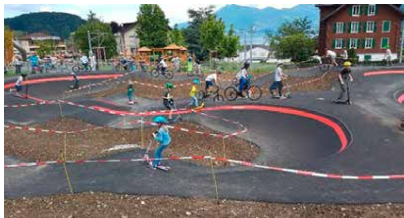
Pumptrack Eröffnung am 9. Juli 2022.