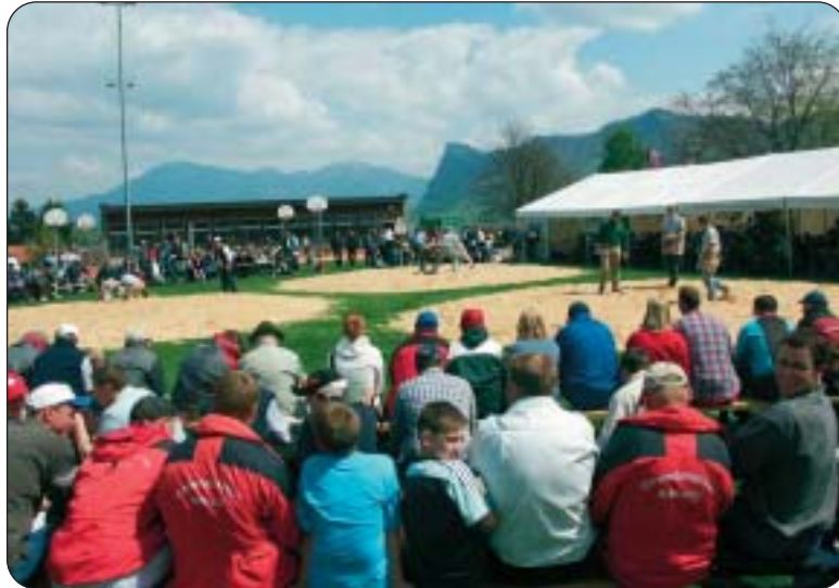
Bald wird im Sägemehl wieder gekämpft.

Im Zentrum stehen die rund 170 Schwinger aus Ob- und Nidwalden, Uri, Luzern, Zug und dem Emmental. Organisator ist der Schwingklub Hergiswil, der zusammen mit zahlreichen Helfern ein prächtiges Fest vorbereitet hat und unter anderem auf dem Fussballplatz Grossmatt eine Arena mit 1200 Sitzplätzen. Geschwungen wird auf fünf kreisrunden Schwing-