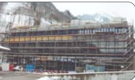
Das neueste Gewerbegebäude.