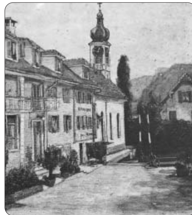
Altes Hotel Krone mit Bahn-Barriere.