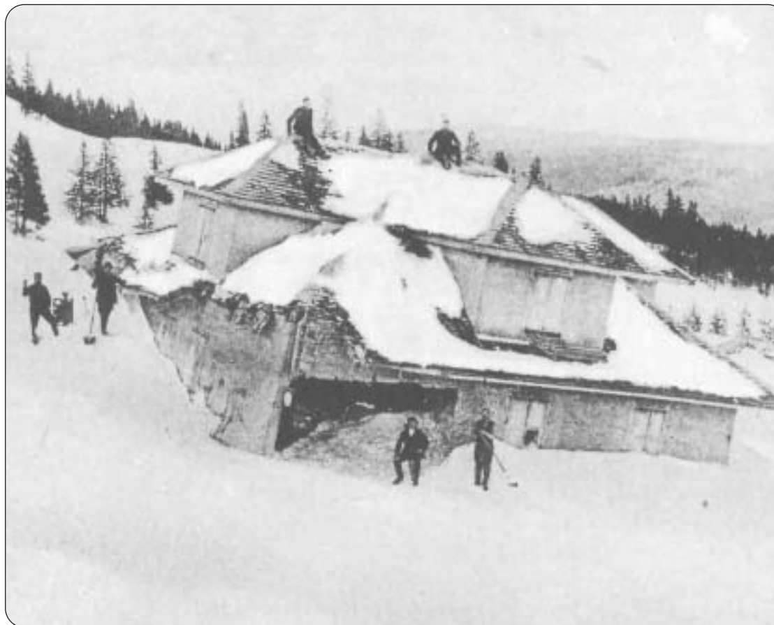
Lawinen-Katastrophe am Pilatus, Winter 1915. Die von einer Staublawine im Februar teilweise zerstörte Alpwirtschaft auf Fräkmünt. Das Gebäude wurde durch den Luftdruck um sechs Meter nach unten verschoben.

Ihre einzige Kritik an Hergiswil ist die fehlende Uferpromenade, denn Irène Schiess ist öfters zu Fuss unterwegs. «Doch vielleicht bin ich in dieser Hinsicht von Buochs her etwas gar verwöhnt», tröstet sie sich. Kurt Liembd