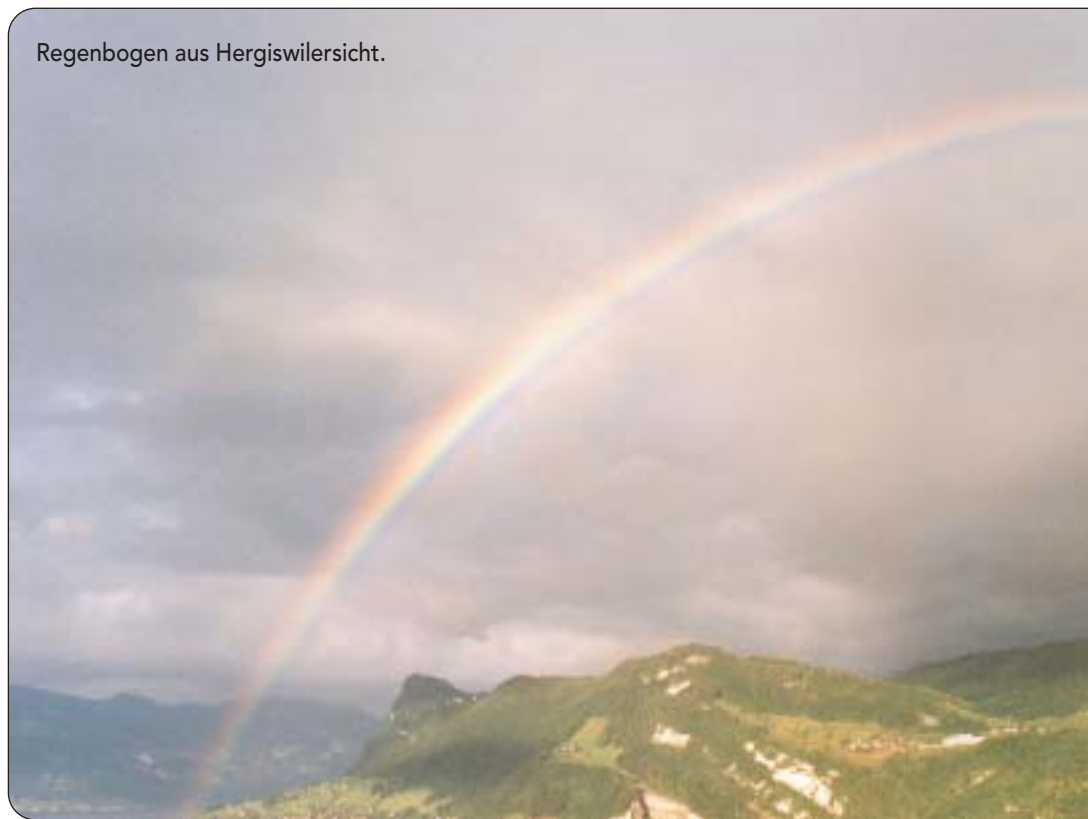
Regenbogen aus Hergiswilersicht.

ler, der mit seiner treuen Begleiterin, einer Nikon-Kamera F-801 und einer F3 Titan, stundenlang warten kann, bis die Lichtverhältnisse optimal sind. Am einmal «geschossenen» Foto wird filmtechnisch am Computer den auch nichts mehr geändert. In Ausstellungen lässt Wechsler teilhaben an seinen persön-