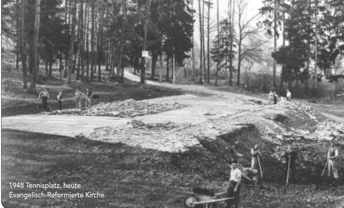
1948 Tennisplatz, heute Evangelisch-Reformierte Kirche.