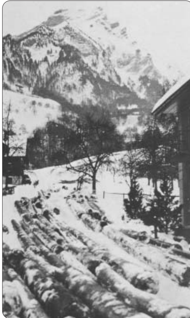
Eine Holzer-Legi bei der alten Krone oberhalb der Bahnlinie.