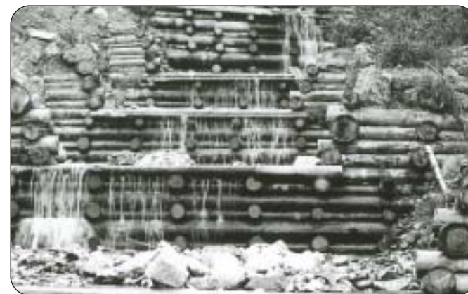
Die Wildbäche sind nach wie vor ein grosses Risiko.

Seit 1974 gibt es in Nidwalden ein Gesetz für die Notorganisation. Bereits damals stellte man mögliche Katastrophen und deren Auswirkungen in einer groben Übersicht zusammen. Seither hat ein grosser Wandel stattgefunden. Die militärische Bedrohung ist heute geringer, dagegen hat die zivile stark zugenommen. Heutige Katastrophen sind unter anderem wegen der hohen Überbauungsdichte komplexer und führen zu grösseren Schäden. Logi-