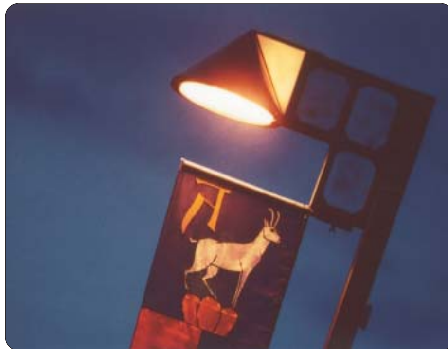
Hergiswil soll eine «Energienstadt» werden.

Für Hergiswil steht dieser Massnahmenkatalog bereits. Er zeigt auf, wo in unserer Gemeinde Handlungsbedarf besteht: Strassenbeleuchtung und Gemeindebauten verbrauchen zu viel Strom, auf der Seestrasse wird zu schnell gefahren, wichtige Fussgängerstreifen fehlen. Hier muss gehandelt