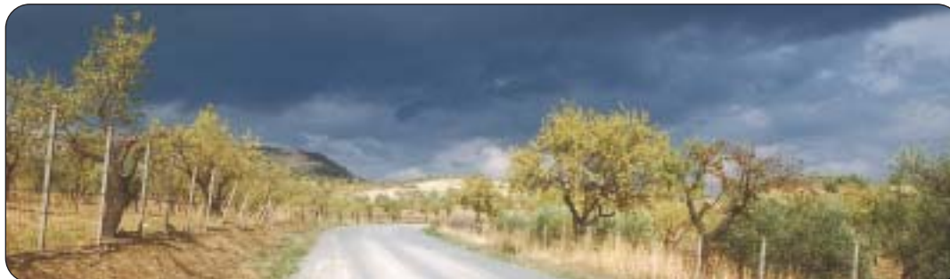
Landesinnere auf Sizilien kurz vor einem Gewitter.

Informationen unter: E-Mail gambio@freesurf.ch , Tel. 041 630 31 62.